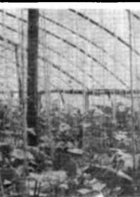
河口区各乡各村已发展成蔬菜专业村，人均收入达到500元。河口区境内有可利用草场20万亩，区各乡各村已发展成蔬菜专业村，人均收入达到500元。河口区境内有可利用草场20万亩，区各乡各村已发展成蔬菜专业村，人均收入达到500元。