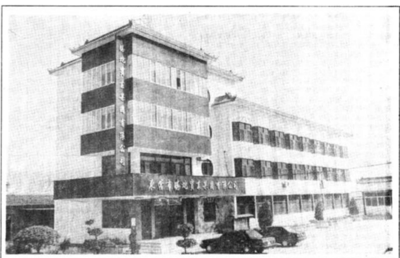
地处胜利油田腹地的胜坨镇，大力开展工农共建活动，促进了本镇和油田的共同发展。

——经济的发展，为社会福利事业提供了强有力的保障。为解决群众看病难，他们投资70万元，建起了卫生院门诊大楼，孩子入学难，镇里又多方筹集资金，在全县率先完成了中小学校舍改造全部达到了“六配套”标准，适龄儿童入学率和小学升初中学率达到了100%，改善了教